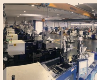
S.L.A.M.P. Gli impianti dello stabilimento di Arcore

Avanzate tecnologie unite ad affidabilità ed efficienza fanno di S.L.A.M.P. una realtà di primo piano nello stampaggio di materiali plastici e termoplastici conto terzi. Fornisce al cliente un servizio completo e all'avanguardia nella lavorazione di materiali plastici anche in grande serie: dalla progettazione allo stampaggio, all'assemblaggio. La S.L.A.M.P. Srl cura l'intero ciclo produttivo per realizzare articoli di alta qualità in collaborazione con i suoi clienti. Strumentazioni e presse, sottoposte a costante aggiornamento tecnologico, sono equipaggiate con i più avanzati impianti di automazione e i migliori sistemi informatici per garantire un controllo di processo sicuro e affidabile. - www.slampsrl.com