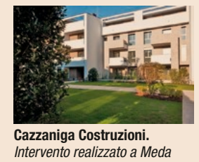
Cazzaniga Costruzioni. Intervento realizzato a Meda

Nata nel 1973 e con sede in Brianza, Cazzaniga Costruzioni è una realtà di spicco nella Building Construction che sa distinguersi nella realizzazione di nuove costruzioni e nelle ristrutturazioni civili e industriali. Centinaia di opere realizzate per committenze pubbliche e private la rendono un marchio riconosciuto nel territorio lombardo, in grado di fornire un supporto tecnico di alto livello sia alla committenza che ai professionisti di settore. Negli ultimi anni, attraverso il proprio marchio ReHabitat, si è imposta nel settore luxury mediante la realizzazione di interventi ad alto profilo in ambito residenziale e retail curandone in piena autonomia design e costruzione. - www.cazzanigacostruzioni.it - www.re-habitat.it